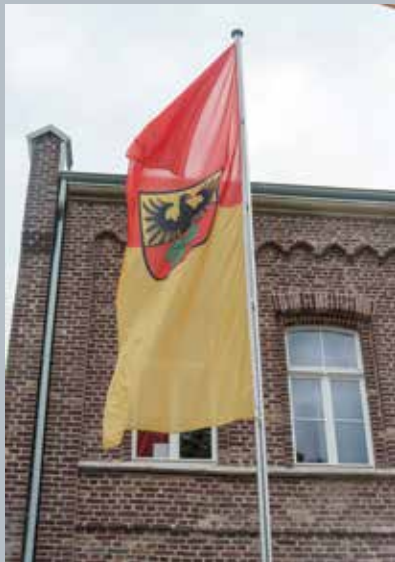
Die Haarener Flagge vor dem Bezirksamt