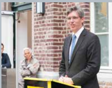
Der Oberbürgermeister gratuliert zum neuen Amt.