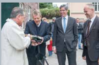
Der Verein Haarener Unternehmer gratuliert zum neuen Bezirksamt.