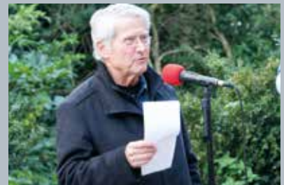
Die Tauffeier des Weidenbachs mit Wasser aus dem Jordan, Themse und Haarbach mit Gedichten, Geschichten und Gesang.