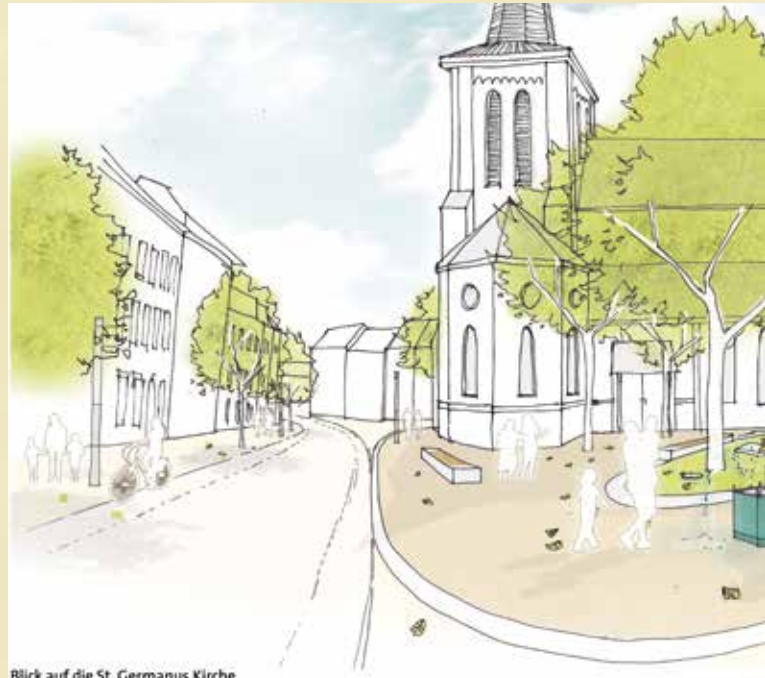
Blick auf die St. Germanus Kirche

In einem Werkstattverfahren sind von drei Planer-Teams Konzepte für die langfristige Umgestaltung der Ortsmitte erstellt worden. Sie wurden im Austausch mit Ortsexperten aus dem Stadtteil sowie Vertretern von Politik und Verwaltung erarbeitet. Bei einer öffentlichen Zwischenpräsentation im November 2017 nutzten außerdem viele Interessierte die Gelegenheit zum Gespräch mit den Planern.