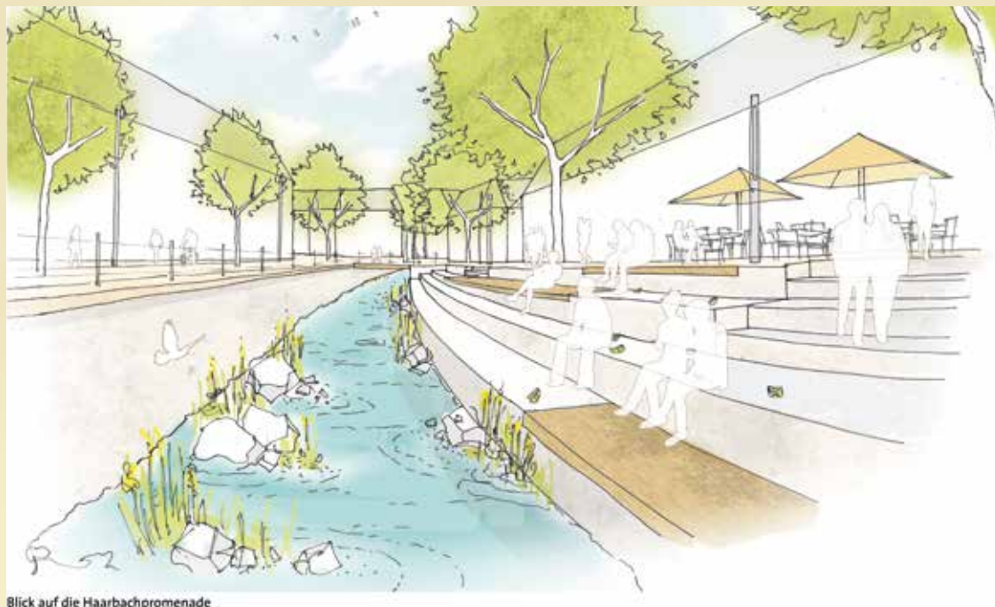
Blick auf die Haarbachpromenade

anstehende weitergehende Planung für diesen Bereich. Für den Grünraum entlang von Wurm und Haarbach konnte sich der Entwurf von 3PLUS Freiraumplaner mit BKI durchsetzen.