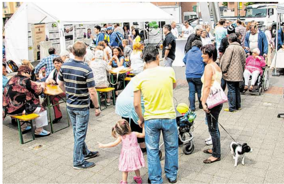
Gefeiert wird die Tour in Haaren bereits ab 12 Uhr mit vielen Aktionen unter dem Motto „Vive la France“.

Aber nicht nur auf dem Markt geht es rund. Auch